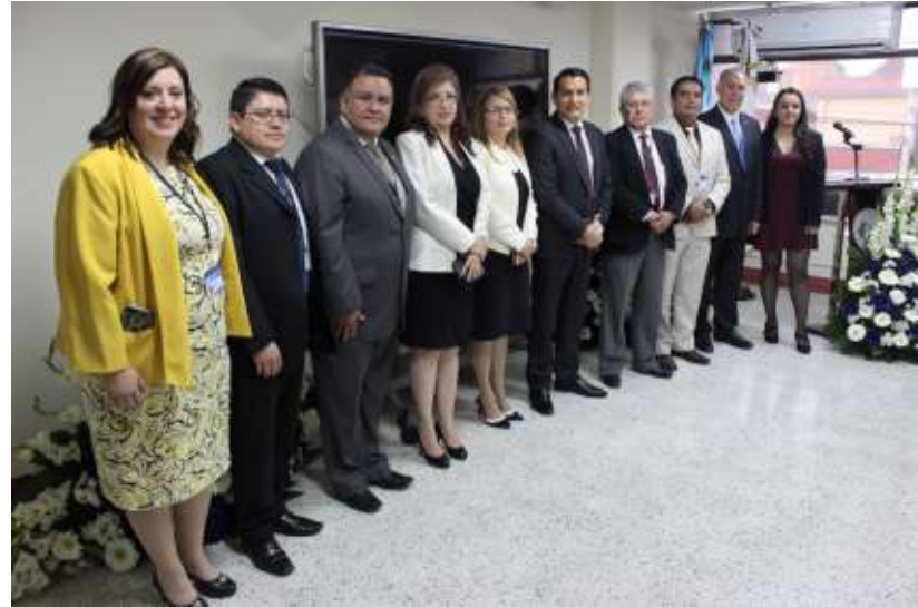
Equipo de Trabajo de la Escuela de Estudios Forenses del INACIF.

Su objetivo general es fortalecer al INACIF, a través de la optimización de las competencias del personal, además de contribuir al Sector Justicia apoyando con los procesos de capacitación de las instituciones relacionadas en temas forenses.