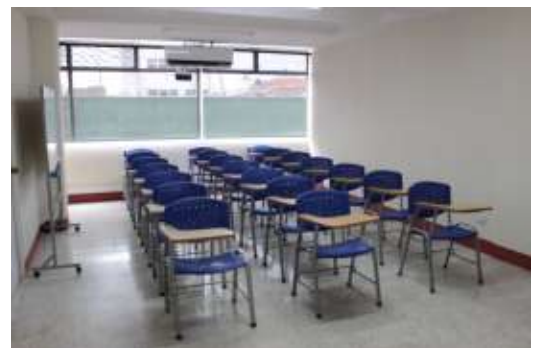
Aulas de la Escuela de Estudios Forenses del INACIF