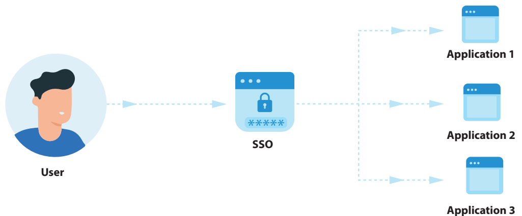
Figura 3. Esquema de trabajo bajo SSO. Tomado de Enterprise SAML-based SSO: Everything you need to know por Zoho Corporation, 2024.

SSO es un servicio para el manejo de sesiones y autenticación de usuarios que permite bajo una única credencial (por ejemplo, usuario y contraseña), acceder a múltiples aplicaciones. La SSO puede ser utilizada por todo tipo de organizaciones (pequeñas, medianas, grandes e inclusive individuales) para la fácil administración, evitando el uso de múltiples usuarios y contraseñas para un mismo usuario.